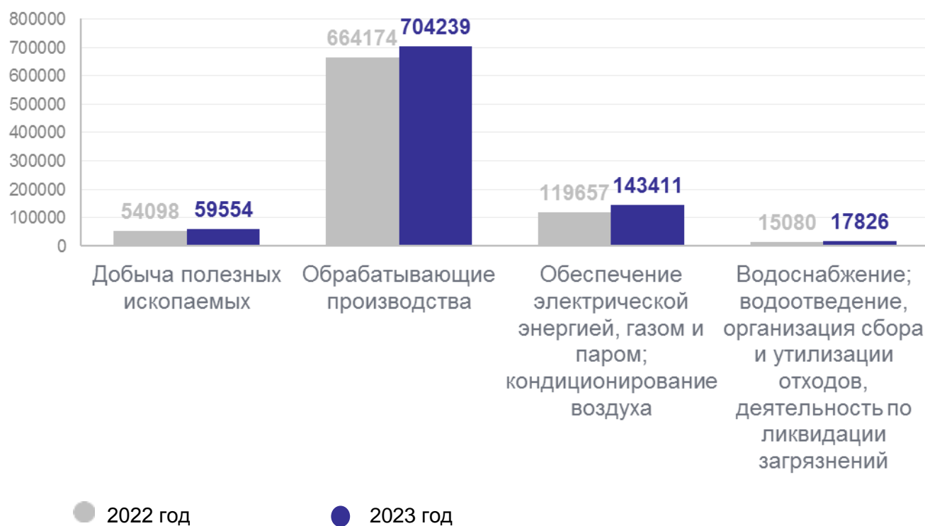
Рис.2 Объем отгруженных товаров собственного производства, выполнено работ и услуг собственными силами по видам экономической деятельности (млн рублей)